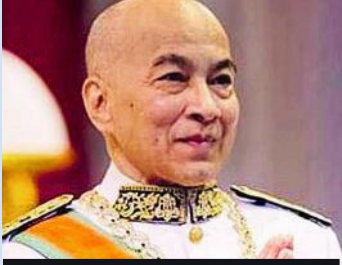
SIHAMONI VON KAMBODSCHA