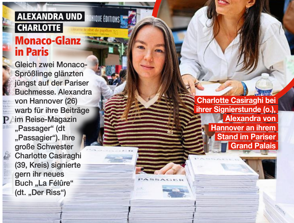
Charlotte Casiraghi bei ihrer Signierstunde (o.), Alexandra von Hannover an ihrem Stand im Pariser Grand Palais