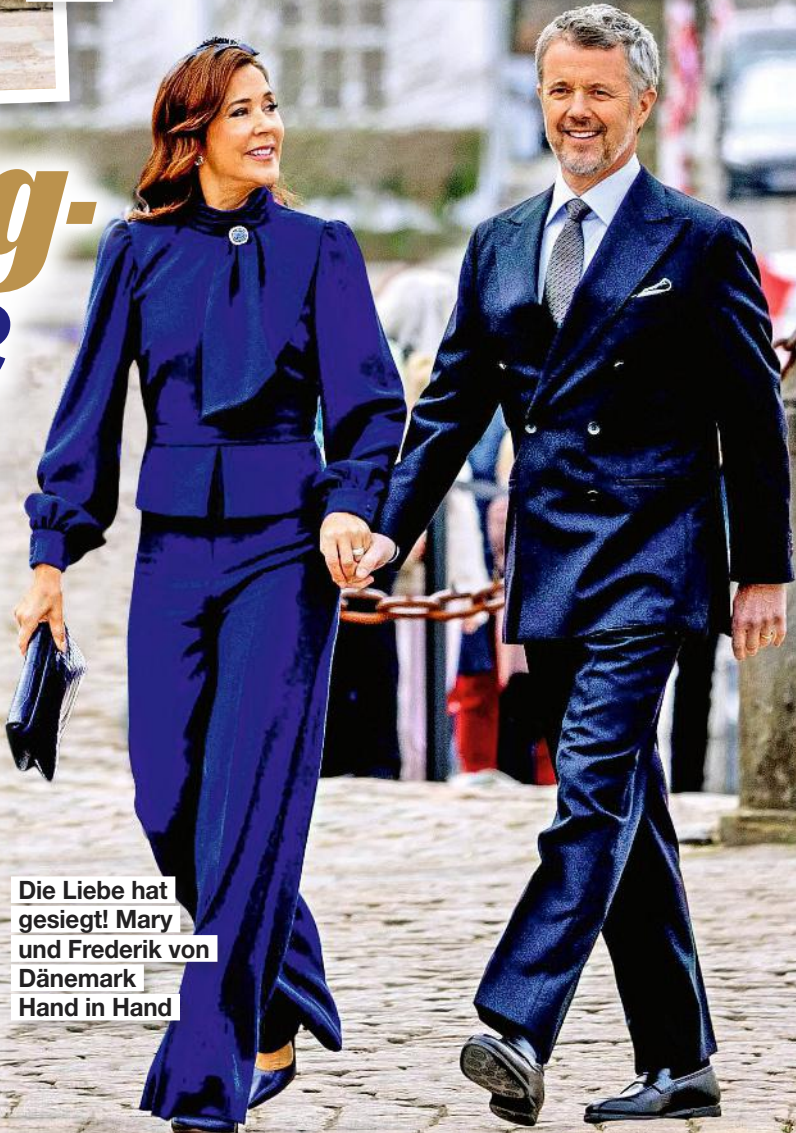
Die Liebe hat gesiegt! Mary und Frederik von Dänemark Hand in Hand