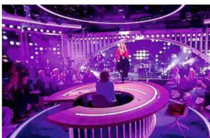
Oh, là, là! Während ihres Auftritts bei „Eva“ tanzte die Sängerin sogar auf dem Tisch