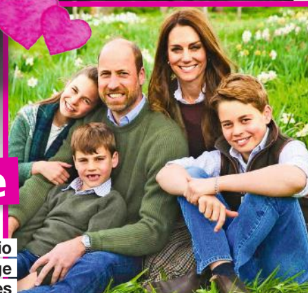
Familienglück: Ihr Trio Charlotte, Louis und George (v.l.) ist ihr Ein und Alles

Warum das Traumpaar seinen Kindern das schönste Geschenk macht