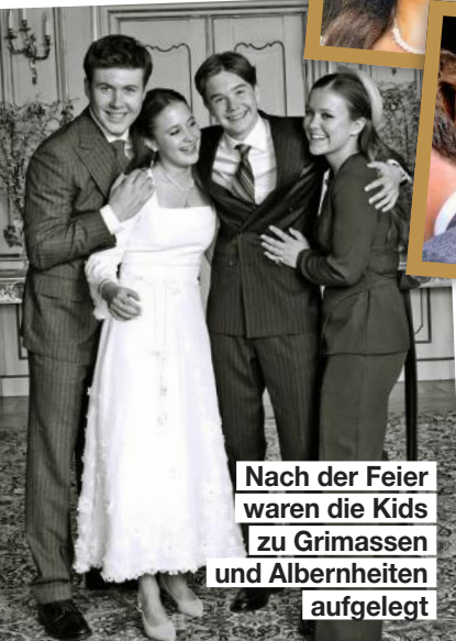
Nach der Feier waren die Kids zu Grimassen und Albernheiten aufgelegt