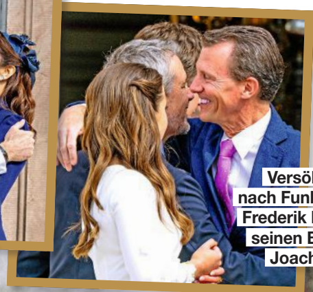
Versöhnung nach Funkstille: Frederik herzte seinen Bruder Joachim (r.)