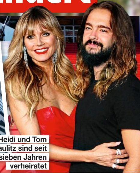
Heidi und Tom Kaulitz sind seit sieben Jahren verheiratet