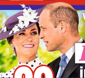
WILLIAM & KATE s. 6