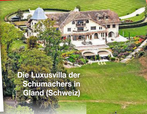
Die Luxusvilla der Schumachers in Gland (Schweiz)

Für die Familie des Formel-1-Stars ist es ein Albtraum. Erschütternd, was jetzt als Licht kommt!