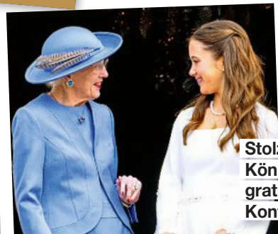
Stolze Oma: Ex-Königin Margrethe gratulierte der Konfirmandin