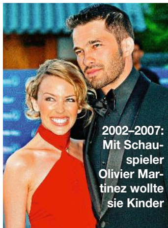
2002–2007: Mit Schauspieler Olivier Martinez wollte sie Kinder

Es kam noch schlimmer: Wie der Film enthüllt, erkrankte die zarte Sängerin 2021 erneut an Brustkrebs. Die Qualen – eine Folter: „Ich war nur noch die Hülle eines Menschen.“ Kraft gab ihr allein die Musik. Und ja, auch den zweiten Krebs drängte sie tapfer zurück. Ein Wunder. Und doch wird Kylie nie vergessen, was ihr verwehrt blieb: das Glück einer Familie.