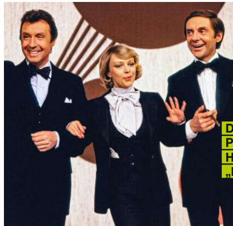
Der TV-Star 1979 mit Peter Alexander und Harald Juhnke (r.) bei „Musik ist Trumpf“

trotz allem nicht unterkriegen. „Ich bin ein positiver Mensch. Ich habe meine Ziele und die setze ich durch.“ Auch dass sie nur noch Haut und Knochen ist, deutet die Künstlerin positiv um: „Ich finde mich nun schöner als vorher. Als ich noch so pummelig war, habe ich viel älter ausgesehen. Ich gefalle mir jetzt besser. Ich bin nur schlecht auf den Beinen, im Augenblick.“ Doch als starke Frau, die sie ist, wird es ihr am Ende hoffentlich gelingen, wieder ganz gesund zu werden. ■