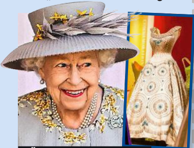
KÖNIGIN ELIZABETH (†)

■ „Ich darf mich in Spanien ‚Don‘ nennen“, enthüllte Hape Kerkeling (61) nun. König Felipe (58) verlieh ihm Adelstitel und das Komturkreuz des Zivilverdienstordens für sein Buch „Ich bin dann mal weg“.