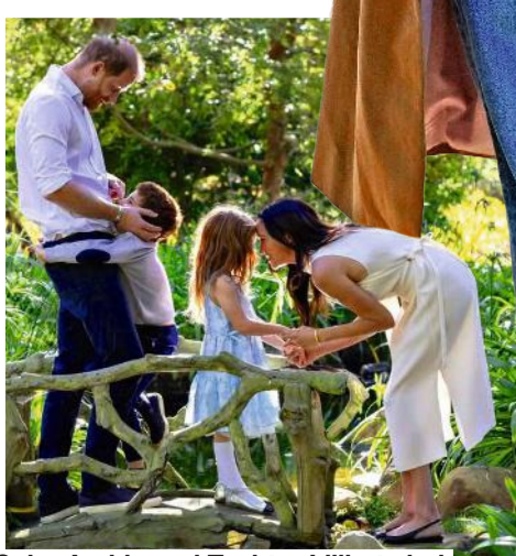
Sohn Archie und Tochter Lilibet sind der ganze Stolz der Sussexes

Harry und seine Frau lieben es auf jeden Fall, Eltern zu sein. Zeit mit Archie (6) und Lilibet (4) zu verbringen, lässt sie immer wieder all die Sorgen, all die Probleme in ihrer Ehe vergessen. Ein süßes Geschwisterchen für ihre Goldstücke könnte die Sussexes also wieder enger zusammenschweißen. Doch mit dem T-Shirt sendet Meghan auch noch eine andere Botschaft. Es stammt von der Organisation „Alliance of Moms“ (dt.: Allianz der Mütter). Diese unterstützte werdende Eltern und Jugendliche im Pflegesystem von Los Angeles. Man kann viel über die Herzogin sagen, doch eines ist sie sicher: eine echte Löwen-Mama mit einem großen Herz für Kinder.