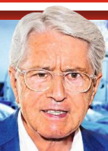
FRANK ELSTNER s. 11