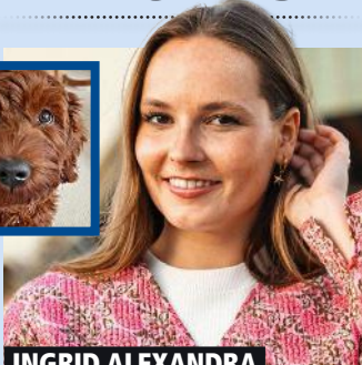
INGRID ALEXANDRA VON NORWEGEN