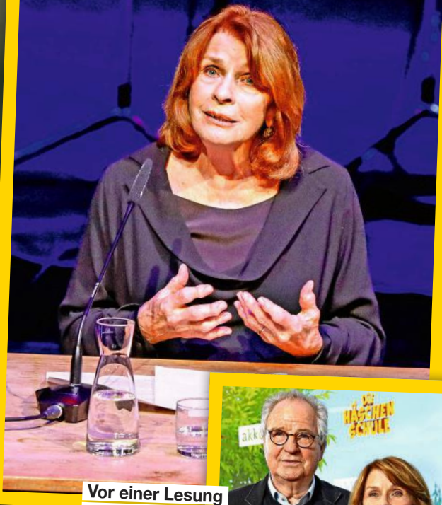
Vor einer Lesung mit Friedrich von Thun in Hamburg stürzte Senta Berger schwer