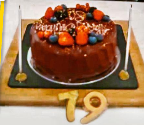
Auf der Torte die 80, davor die 79 – der Sänger schaut auf ein bewegtes Leben zurück