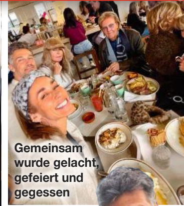
Gemeinsam wurde gelacht, gefeiert und gegessen