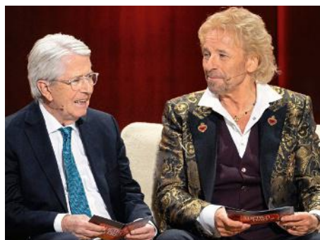
Ihre Vorgänger: Frank Elstner (l.) und Thomas Gottschalk