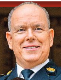
FÜRST ALBERT S. 5