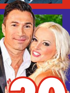
DANIELA KATZENBERGER S. 6