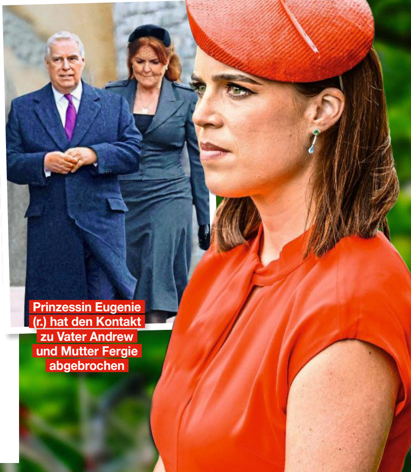
Prinzessin Eugenie (r.) hat den Kontakt zu Vater Andrew und Mutter Fergie abgebrochen

So schwer es ihr auch fiel: Nun traf Eugenie eine schwere Entscheidung – für ihre Zukunft, auch innerhalb der Königsfamilie, und gegen ihre Eltern. ■