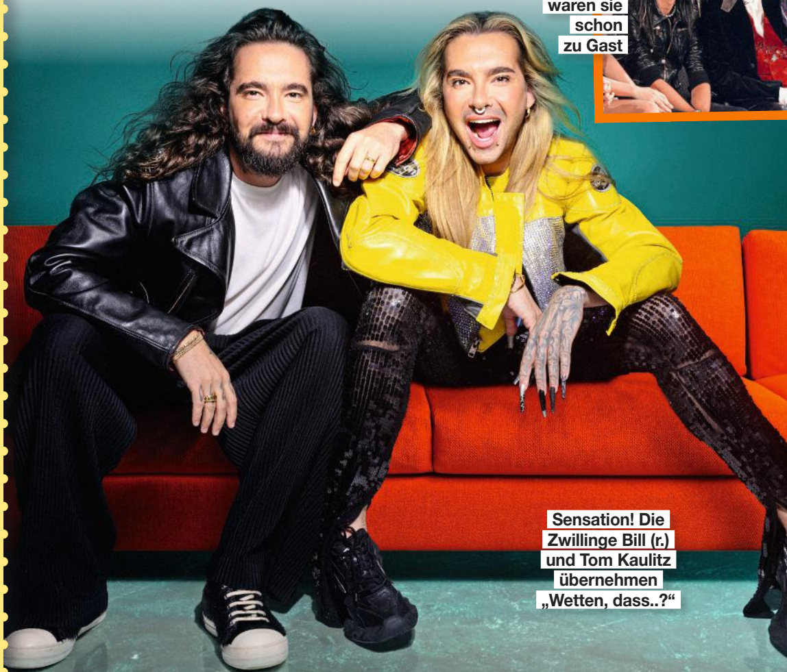
Sensation! Die Zwillinge Bill (r.) und Tom Kaulitz übernehmen „Wetten, dass..?“