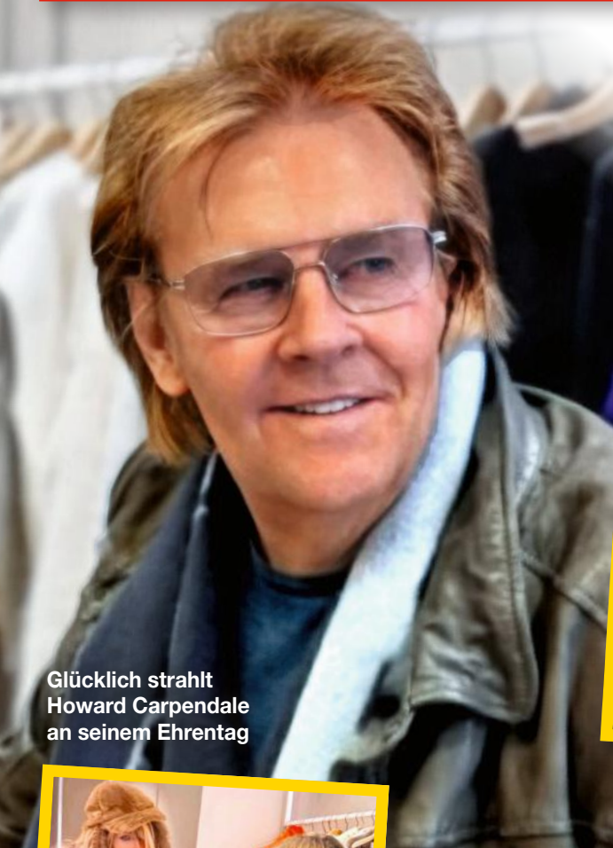
Glücklich strahlt Howard Carpendale an seinem Ehrentag