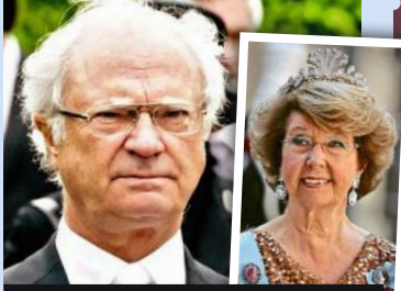
CARL GUSTAF VON SCHWEDEN