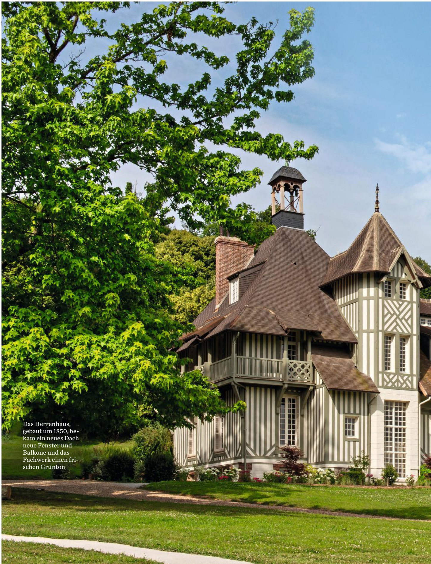
Das Herrenhaus, gebaut um 1850, bekam ein neues Dach, neue Fenster und Balkone und das Fachwerk einen frischen Grünton