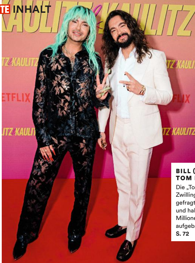
BILL (L.) & TOM KAULITZ Die „Tokio Hotel“-Zwillinge sind so gefragt wie nie und haben sich ein Millionen-Imperium aufgebaut S. 72

Sieben Jahre nach dem Tod des Modeschöpfers wird sein Testament angefochten. Wer nun erben könnte und wer womöglich leer ausgeht S. 30