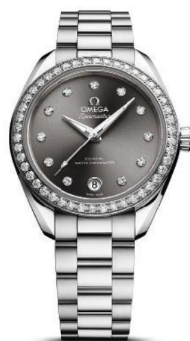
SEAMASTER #AQUATERRA 30 MM Co-Axial Master Chronometer