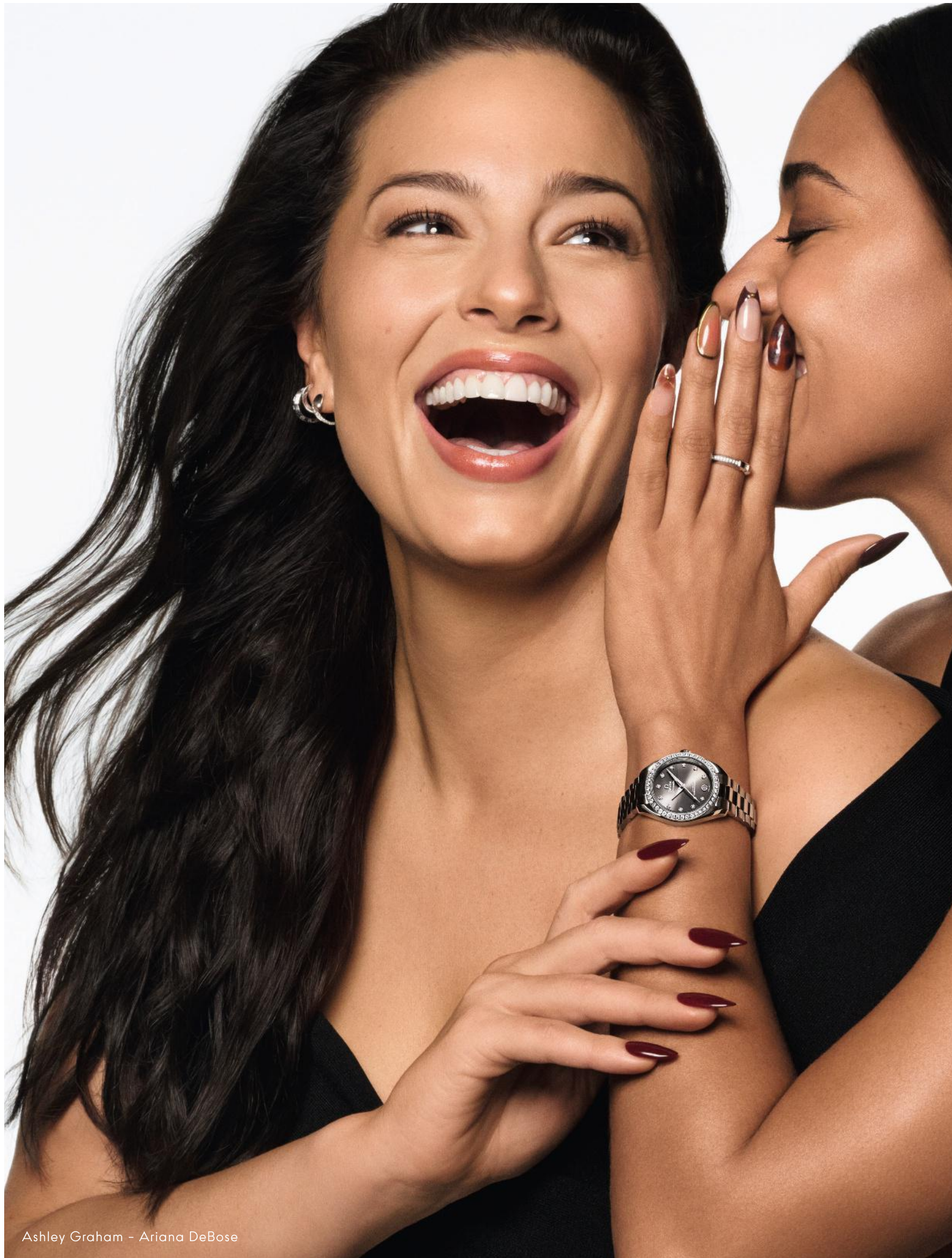
Ashley Graham - Ariana DeBose