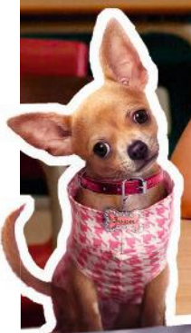
Auch Chihuahua Brutus ist modisch top ausgestattet

› bringen und verlor dabei die Essenz. Auch Liebling Kim Cattrall gab dem Revival einen Korb. „Es ist eine große Weisheit, zu wissen, wann genug ist. Ich wollte auch keine Kompromisse eingehen, was die Serie für mich war“, erklärte sie und sollte recht behalten. Nach Staffel drei war Schluss. Auch die „Harry Potter“-Serie (ab 26.12., HBO Max) steht vor dem Start in der Kritik. Fans bemängeln, dass Sets, Kostüme und Figuren den Filmen zu sehr ähneln. Zudem ist das Milliardenprojekt durch umstrittene Transgender-Aussagen von Autorin J. K. Rowling politisch aufgeladen. Höchstwahrscheinlich zündet der Zauber trotzdem.