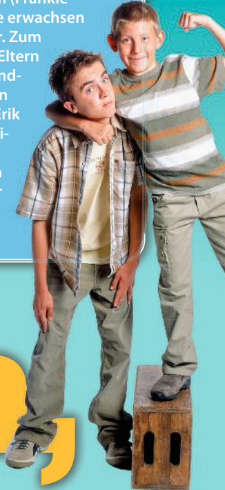
Erik Per Sullivan (r.) spielte im Original Bruder Dewey

Der chaotische Alltag der Untere-Mittelschicht-Familie begleitete uns in den frühen 2000er-Jahren . 2006 wurde „Malcolm mittendrin“ nach sieben Staffeln eingestellt. Nun kommt es zu einem Wiedersehen. Malcolm (Frankie Muniz) ist mittlerweile erwachsen und Vater einer Tochter. Zum 40. Hochzeitstag seiner Eltern kehrt er in sein altes Jugendzimmer zurück. Bis auf den jüngsten Bruder Dewey (Erik Per Sullivan) ist die damalige Besetzung wieder dabei – auch Bryan Cranston („Breaking Bad“) als Vater Hal! Die vier neuen Folgen gibt es bei Disney+.