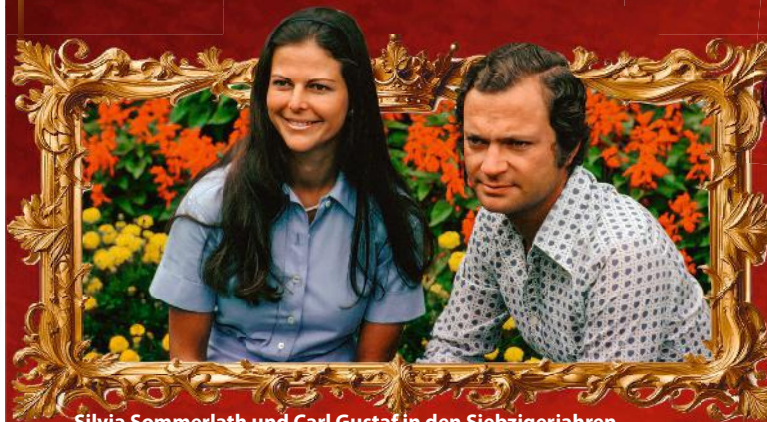
Silvia Sommerlath und Carl Gustaf in den Siebzigerjahren