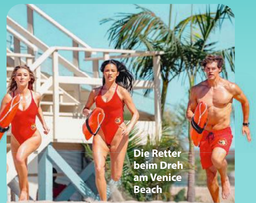
Die Retter beim Dreh am Venice Beach

Der Grat zwischen Nostalgie und echter Innovation ist schmal. Die Erinnerung an alte Lieblingsserien ist oft idealisiert – Enttäuschungen sind vorprogrammiert. Ein Beispiel ist „Sex and the City“ (1998–2004). Damals ein popkulturelles Ereignis, weil es selbstbestimmte Frauen in den Fokus stellte; doch die Fortsetzung „And Just Like That...“ (2021–2025) wollte zu viele Themen wie Wokeness und Diversität unter-