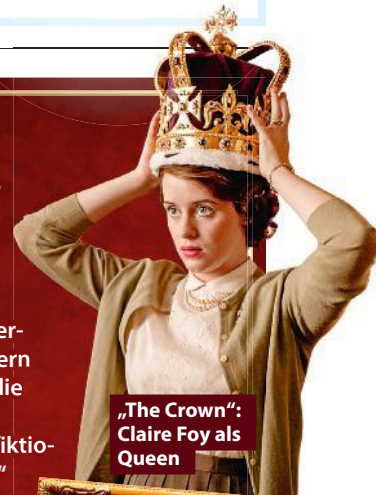
„The Crown“: Claire Foy als Queen

von Kronprinz Carl Gustaf. Die Eventserie soll zunächst bei Prime Video und danach bei Sat.1 zu sehen sein. Wer sich die Wartezeit mit Geschichten aus anderen Königshäusern verkürzen möchte, ist mit Klassikern wie „The Crown“ (Netflix) um die britischen Royals gut bedient. Spaniens Adel ist in der stark fiktionalisierten Serie „Su Majestad“ bei Prime Video im Fokus.