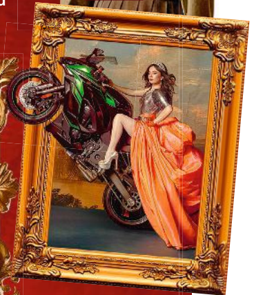
Eine fiktionale Prinzessin: „Su Majestad“