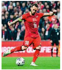
Hakan Çalhanoğlu im Spiel gegen den Kosovo bei den Play-offs

Es ist das erste Mal seit 2002, dass es die Türkei in eine WM-Endrunde geschafft hat. Besonderer Bonus für Fans des Teams: Bei der Fußball-WM 2026 (11.6. bis 19.7.) zeigt Magenta TV alle 103 Spiele – die drei Gruppenspiele der Türkei (14., 20., 26.6.) nicht nur mit deutschem, sondern auch mit türkischem Kommentar! Dazu berichten Experten in der Landessprache.