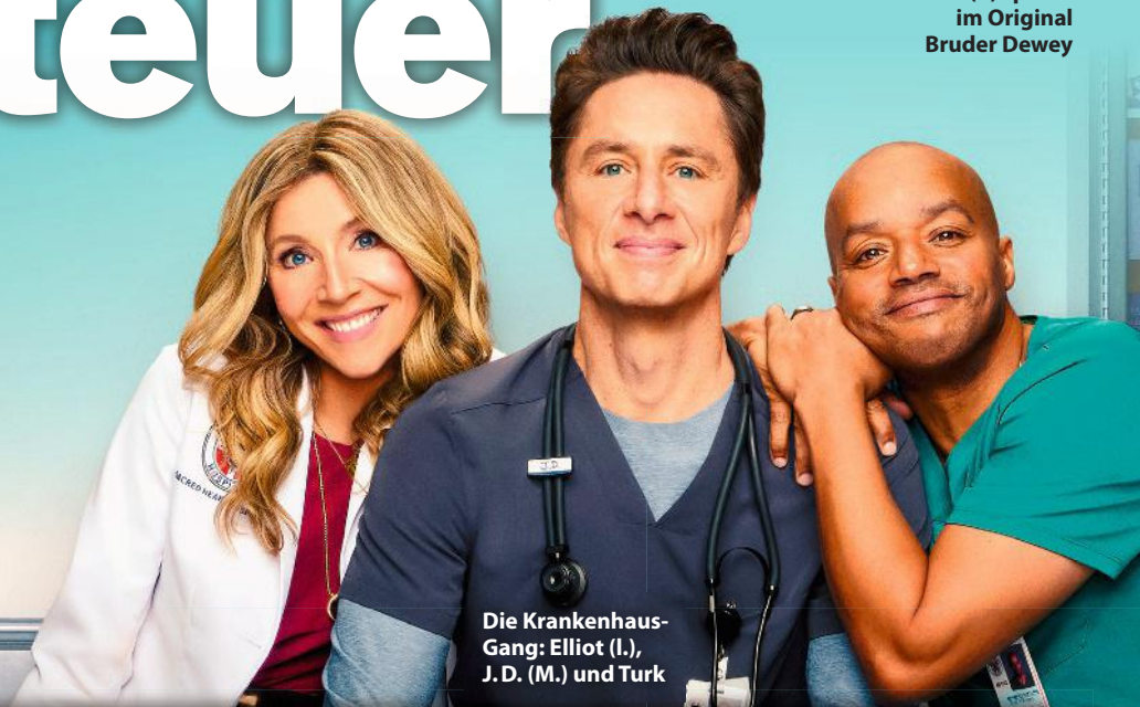
Die Krankenhaus-Gang: Elliot (l.), J.D. (M.) und Turk

War früher wirklich alles besser? Viele Serien- und Filmklassiker erleben gerade ihr Revival