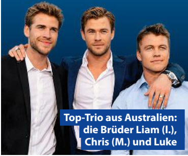
Top-Trio aus Australien: die Brüder Liam (l.), Chris (M.) und Luke

Luke Hemsworth (r.), selbst Schauspieler („Westworld“), hätte große Lust darauf, mit seinen Brüdern Chris („Avenge: Domsday“) und Liam („The Witcher“) zusammenzuarbeiten. Schwierig jedoch bei so vollen Drehplänen.