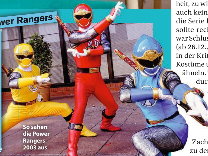
So sahen die Power Rangers 2003 aus

Ursprünglich plante Netflix eine „Power Rangers“-Adaption, doch dann sicherte sich Disney+ die Rechte. Das Reboot soll komplett anders werden: neues Team, neue Anzüge, neue Monster. Erstmals werden die Actionszene n selbst produziert, anstatt wie früher auf Szenen aus der japanischen Vorlage „Super Sentai“ zurückzugreifen. Für den Cast soll u. a. Momona Tamada („Avatar“) im Gespräch sein.