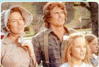
Die Ingalls ziehen in die Prärie