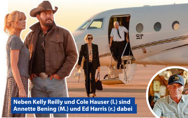
Neben Kelly Reilly und Cole Hauser (l.) sind Annette Bening (M.) und Ed Harris (r.) dabei

■ Mit „Dutton Ranch“ zeigt Paramount+ ab dem 15. Mai ein weiteres Sequel zur Serie „Yellowstone“! Beth Dutton (Kelly Reilly) und Rip Wheeler (Cole Hauser) wagen einen Neuanfang in Texas. Neu im Ensemble: Annette Bening als mächtige Farmerin und Ed Harris als einfühlsamer Tierarzt und Veteran.