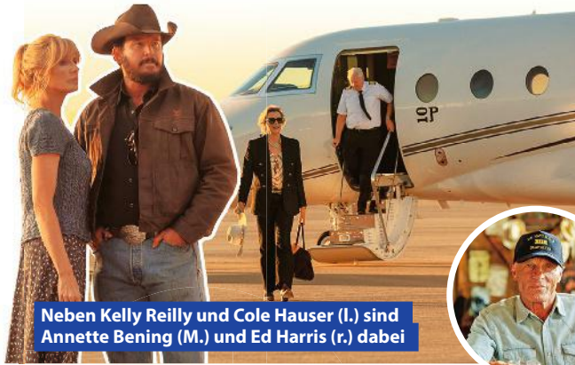
Neben Kelly Reilly und Cole Hauser (l.) sind Annette Bening (M.) und Ed Harris (r.) dabei

■ Mit „Dutton Ranch“ zeigt Paramount+ ab dem 15. Mai ein weiteres Sequel zur Serie „Yellowstone“! Beth Dutton (Kelly Reilly) und Rip Wheeler (Cole Hauser) wagen einen Neuanfang in Texas. Neu im Ensemble: Annette Bening als mächtige Farmerin und Ed Harris als einfühlsamer Tierarzt und Veteran.