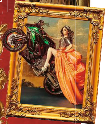
Eine fiktionale Prinzessin: „Su Majestad“