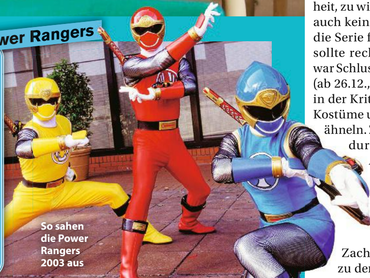
So sahen die Power Rangers 2003 aus

Ursprünglich plante Netflix eine „Power Rangers“-Adaption, doch dann sicherte sich Disney+ die Rechte. Das Reboot soll komplett anders werden: neues Team, neue Anzüge, neue Monster. Erstmals werden die Actionszene n selbst produziert, anstatt wie früher auf Szenen aus der japanischen Vorlage „Super Sentai“ zurückzugreifen. Für den Cast soll u. a. Momona Tameda („Avatar“) im Gespräch sein.