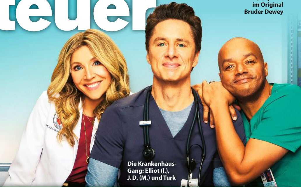
Die Krankenhaus-Gang: Elliot (l.), J.D. (M.) und Turk

War früher wirklich alles besser? Viele Serien- und Filmklassiker erleben gerade ihr Revival