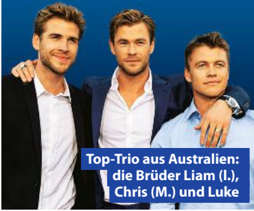
Top-Trio aus Australien: die Brüder Liam (l.), Chris (M.) und Luke

Luke Hemsworth (r.), selbst Schauspieler („Westworld“), hätte große Lust darauf, mit seinen Brüdern Chris („Avenge: Domsday“) und Liam („The Witcher“) zusammenzuarbeiten. Schwierig jedoch bei so vollen Drehplänen.