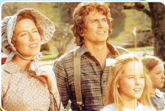
Die Ingalls ziehen in die Prärie