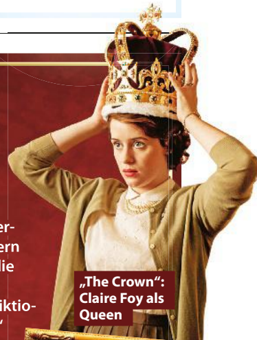
„The Crown“: Claire Foy als Queen

von Kronprinz Carl Gustaf. Die Eventserie soll zunächst bei Prime Video und danach bei Sat.1 zu sehen sein. Wer sich die Wartezeit mit Geschichten aus anderen Königshäusern verkürzen möchte, ist mit Klassikern wie „The Crown“ (Netflix) um die britischen Royals gut bedient. Spaniens Adel ist in der stark fiktionalisierten Serie „Su Majestad“ bei Prime Video im Fokus.