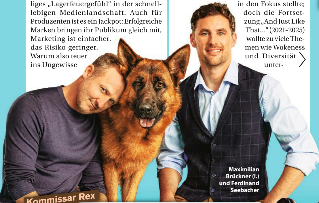
Maximilian Brückner (l.) und Ferdinand Seebacher