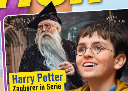
Harry Potter Zauberer in Serie

Von Prequel bis Fortsetzung: Diese Kult-Hits starten noch mal durch!