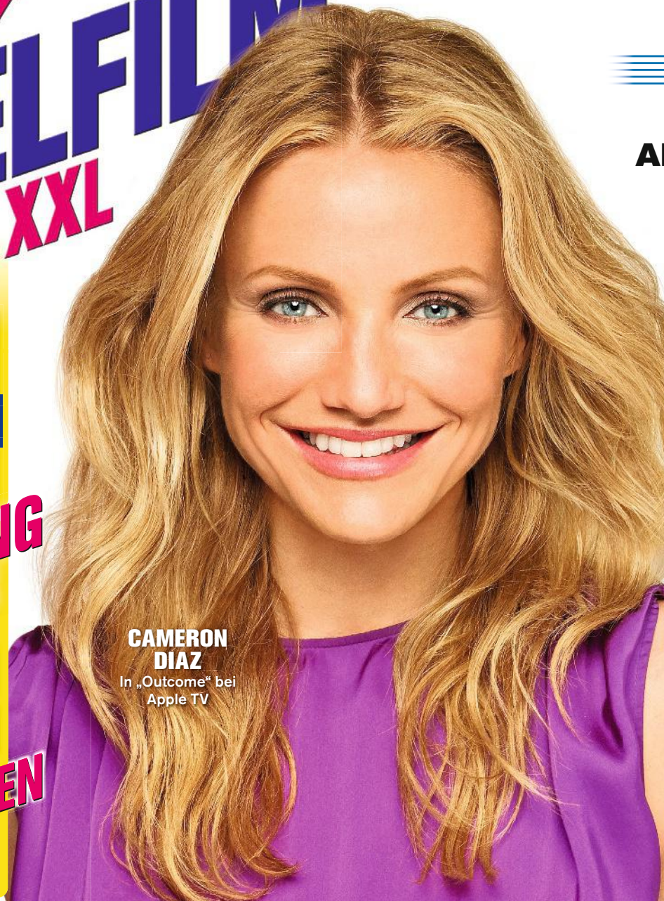
CAMERON DIAZ In „Outcome“ bei Apple TV