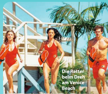
Die Retter beim Dreh am Venice Beach

Der Grat zwischen Nostalgie und echter Innovation ist schmal. Die Erinnerung an alte Lieblingsserien ist oft idealisiert – Enttäuschungen sind vorprogrammiert. Ein Beispiel ist „Sex and the City“ (1998–2004). Damals ein popkulturelles Ereignis, weil es selbstbestimmte Frauen in den Fokus stellte; doch die Fortsetzung „And Just Like That...“ (2021–2025) wollte zu viele Themen wie Wokeness und Diversität unter-