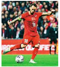
Hakan Çalhanoğlu im Spiel gegen den Kosovo bei den Play-offs

Es ist das erste Mal seit 2002, dass es die Türkei in eine WM-Endrunde geschafft hat. Besonderer Bonus für Fans des Teams: Bei der Fußball-WM 2026 (11.6. bis 19.7.) zeigt Magenta TV alle 103 Spiele – die drei Gruppenspiele der Türkei (14., 20., 26.6.) nicht nur mit deutschem, sondern auch mit türkischem Kommentar! Dazu berichten Experten in der Landessprache.