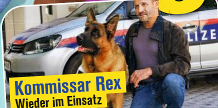
Kommisar Rex Wieder im Einsatz