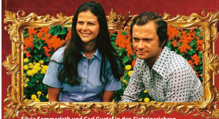
Silvia Sommerlath und Carl Gustaf in den Siebzigerjahren