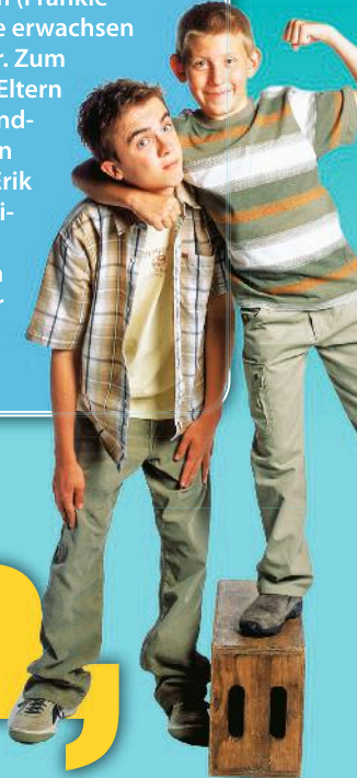
Erik Per Sullivan (r.) spielte im Original Bruder Dewey

Der chaotische Alltag der Untere-Mittelschicht-Familie begleitete uns in den frühen 2000er-Jahren . 2006 wurde „Malcolm mittendrin“ nach sieben Staffeln eingestellt. Nun kommt es zu einem Wiedersehen. Malcolm (Frankie Muniz) ist mittlerweile erwachsen und Vater einer Tochter. Zum 40. Hochzeitstag seiner Eltern kehrt er in sein altes Jugendzimmer zurück. Bis auf den jüngsten Bruder Dewey (Erik Per Sullivan) ist die damalige Besetzung wieder dabei – auch Bryan Cranston („Breaking Bad“) als Vater Hal! Die vier neuen Folgen gibt es bei Disney+.