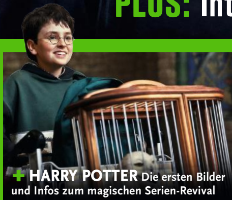
+ HARRY POTTER Die ersten Bilder und Infos zum magischen Serien-Revival

PLUS: Interview mit Regisseur Jon Favreau