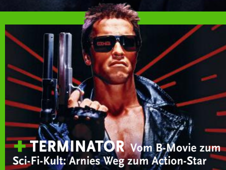
+ TERMINATOR Vom B-Movie zum Sci-Fi-Kult: Arnies Weg zum Action-Star