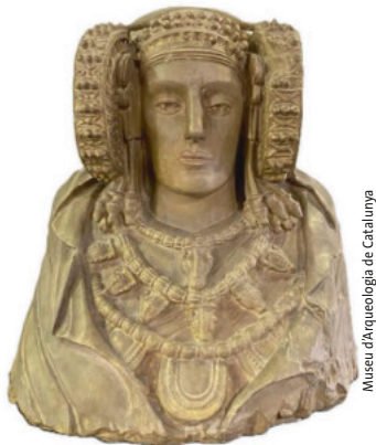
Museu d'Arqueologia de Catalunya

In Kooperation mit dem Museu d'Arqueologia de Catalunya in Barcelona und dem Antikenmuseum Basel präsentiert das Museum Mistelbach in Niederösterreich eine Ausstellung, die sich einem der weniger bekannten Völker der Antike widmet: den Iberern. Die Schau „Die geheimnisvolle