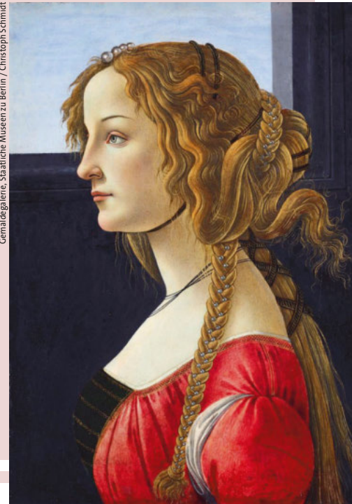
Geflochtene Vollkommenheit: Sandro Botticellis „Profilbildnis einer jungen Frau“, 1475–1480.

schriften bisher nicht gelungen, die iberische Sprache zu übersetzen. Zugleich zeigen die Funde, wie vielfältig die iberischen Kulturen waren – im Austausch mit griechischen Kolonien an den Küsten, phönizischen Handelsnetzen und keltischen Gruppen im Inneren bildeten sich regional sehr unterschiedliche Traditionen, Dialekte sowie charakteristische Formen von Kunst und Handwerk.