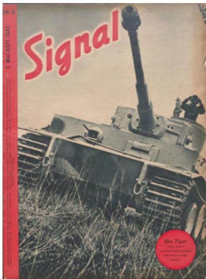
Zeitschrift: Signal, 10/1943, Titel (MHN)

Wirklich oder vermeintlich überlegene Kriegstechnik war von Beginn an ein zentraler Baustein der NS-Kriegspropaganda. Mal handelte es sich bei den „Wunderwaffen“ um wirkungsvoll inszenierte konventionelle Waffensysteme wie die „Stuka“,