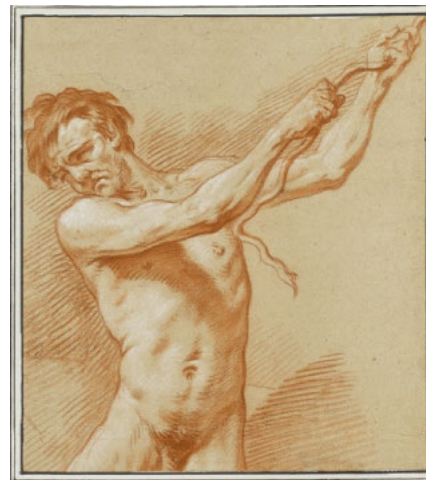
Staatsgalerie Stuttgart, Graphische Sammlung

Die Ausstellung „Generation 1700. Zeichnen an der Königlichen Akademie in Paris“ in der Staatsgalerie Stuttgart zeigt bis zum 30. August 2026 rund 80 größtenteils nie gezeigte Zeichnungen, Druckgraphiken und Gemälde, die Zeugnis vom Studium der Anatomie durch die Künstler der französischen Aufklärung ablegen. Im Zentrum der Ausstellung stehen die Werke des