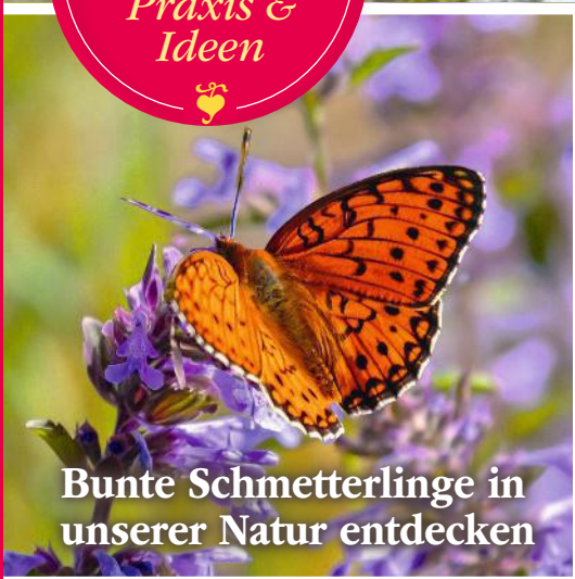
Bunte Schmetterlinge in unserer Natur entdecken