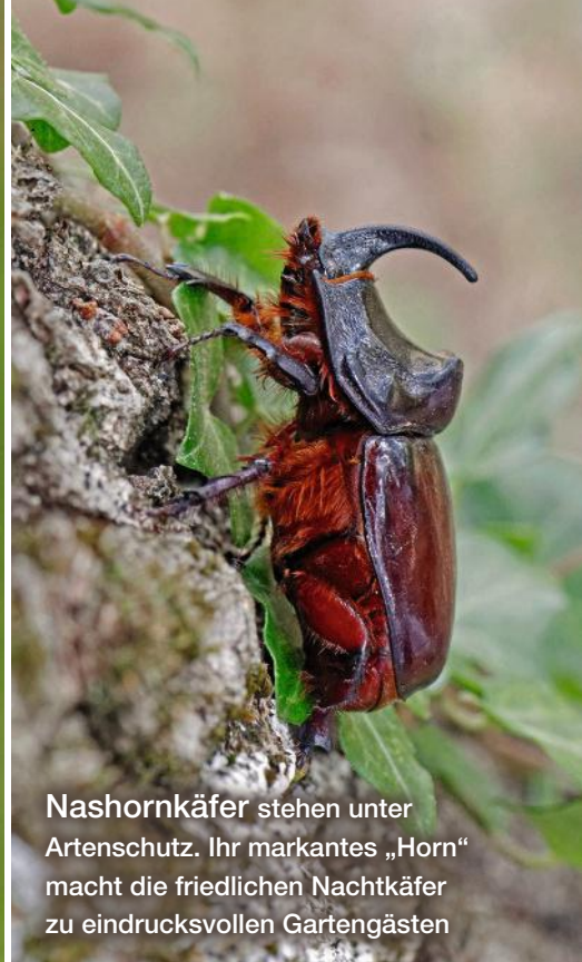
Nashornkäfer stehen unter Artenschutz. Ihr markantes „Horn“ macht die friedlichen Nachtkäfer zu eindrucksvollen Gartengästen

Diese zwei Sonnenliebhaber sind oft am selben Ort zu finden. Verwechseln kann man sie dennoch kaum: Das Tagpfauenauge (unten) erkennt man an seinen großen Augenflecken, der Admiral (rechts) trägt eine Paradeuniform aus orangefarbener Binde und weißen Tupfen