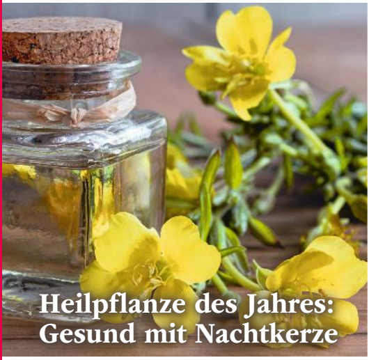
Heilpflanze des Jahres: Gesund mit Nachtkerze