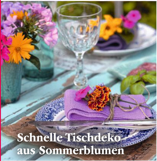
Schnelle Tischdeko aus Sommerblumen