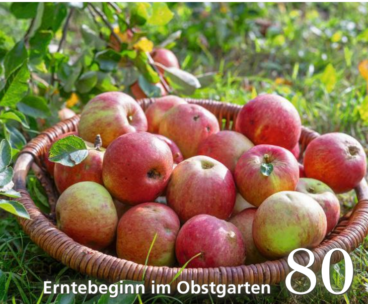
Erntebeginn im Obstgarten