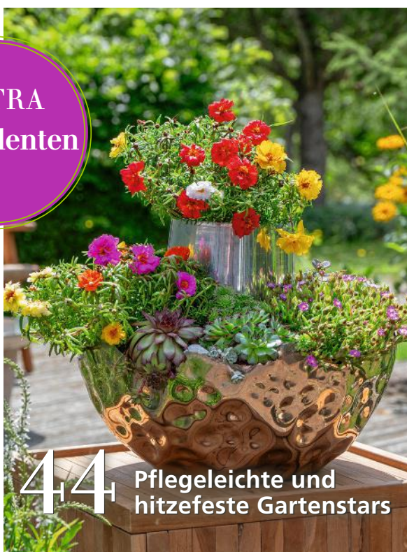
44 Pflegeleichte und hitzefeste Gartenstars