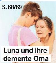
Luna und ihre demente Oma

„Das Gedächtnis schwindet, aber die Nähe bleibt“