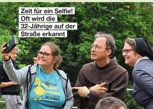
Zeit für ein Selfie! Oft wird die 32-Jährige auf der Straße erkannt