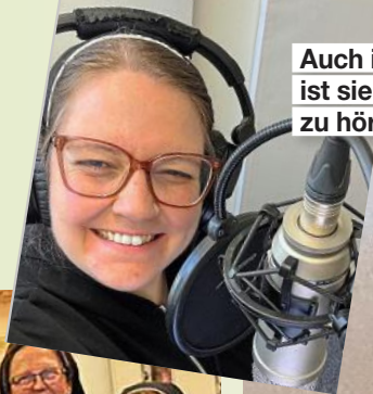
Auch in Podcasts ist sie regelmäßig zu hören