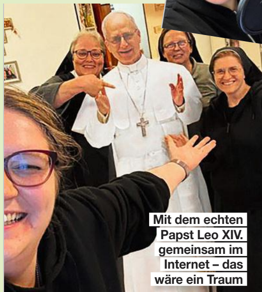
Mit dem echten Papst Leo XIV. gemeinsam im Internet – das wäre ein Traum