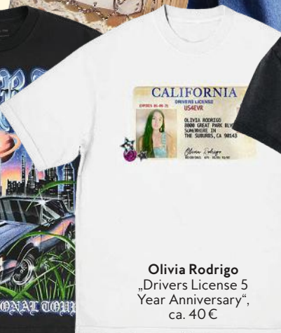
Olivia Rodrigo „Drivers License 5 Year Anniversary“, ca. 40 €