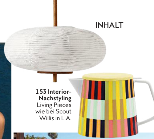
153 Interior-Nachstyling Living Pieces wie bei Scout Willis in L.A.