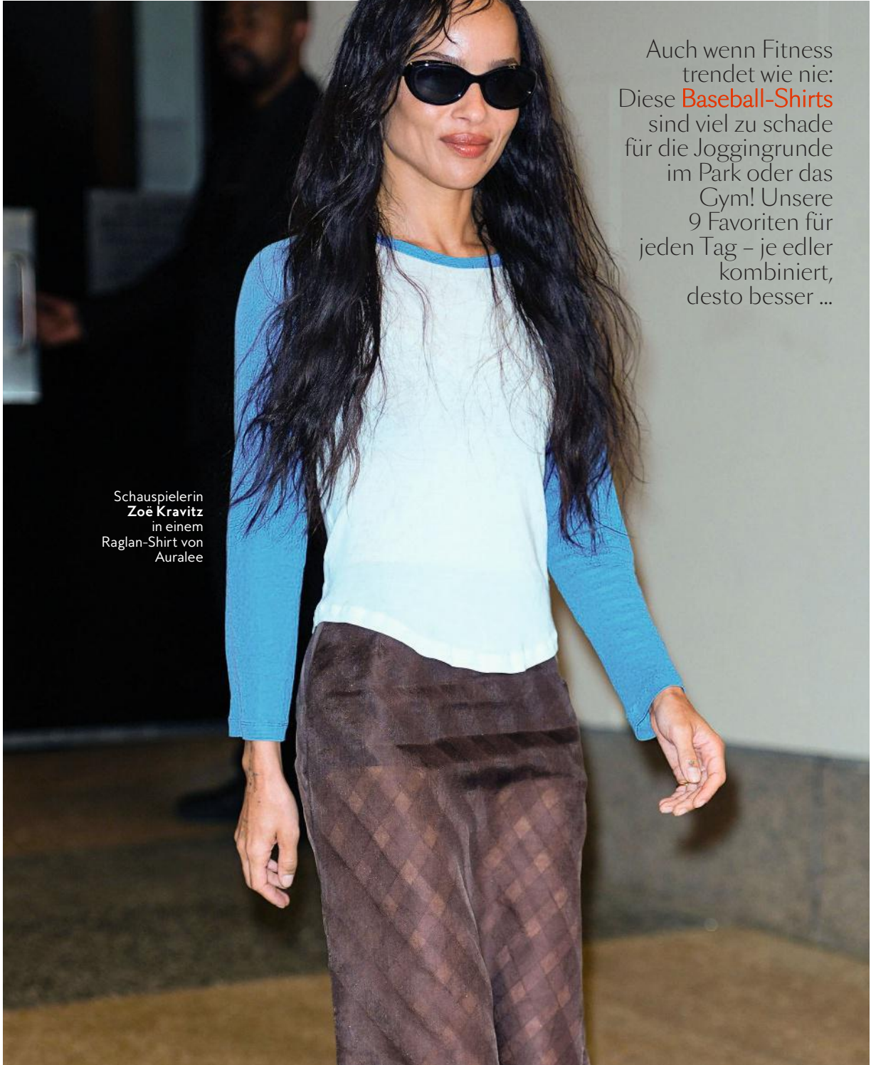
Schauspielerin Zoë Kravitz in einem Raglan-Shirt von Auralee