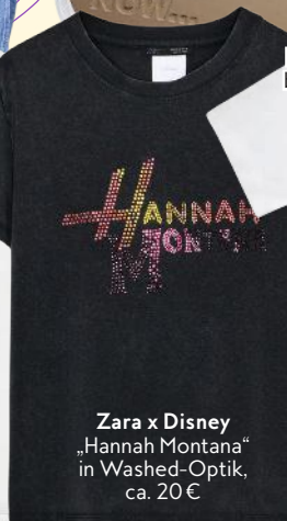
Zara x Disney „Hannah Montana“ in Washed-Optik, ca. 20 €