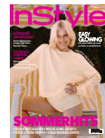
Cover: Selma Blair Sweatshirt & Shorts: High Sport