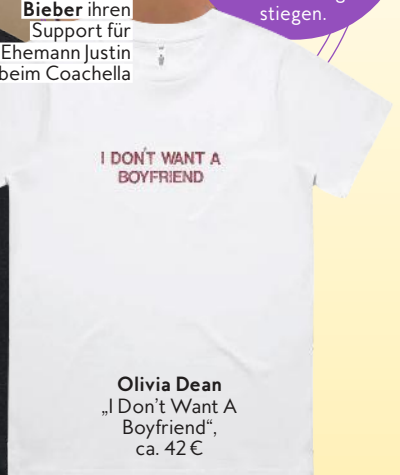
Olivia Dean „I Don't Want A Boyfriend“, ca. 42 €

Früher kaufte man sich ein Merch-Shirt nach dem Konzert als Erinnerung. Heute ist es der eigentliche Hauptact!