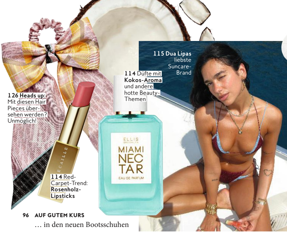
126 Heads up: Mit diesen Hair Pieces übersehen werden? Unmöglich!