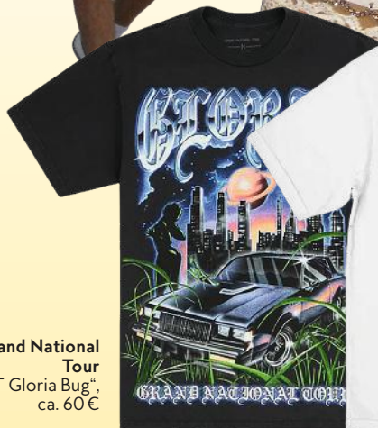
Grand National Tour „GNT Gloria Bug“, ca. 60 €

Timothée Chalamet mit dem „Supreme x Wu-Tang Clan RZA“-T-Shirt