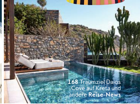
168 Traumziel Daios Cove auf Kreta und andere Reise-News