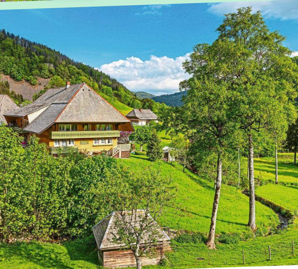
Noch sind die Sitzplätze an diesem tollen Wanderpfad bei Breitnau frei