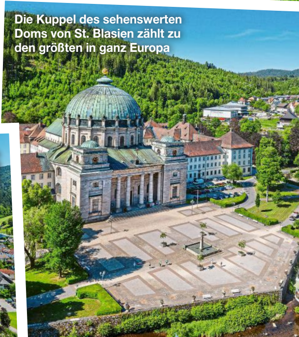
Die Kuppel des sehenswerten Doms von St. Blasien zählt zu den größten in ganz Europa