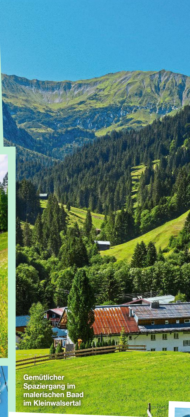
Gemütlicher Spaziergang im malerischen Baad im Kleinwalsertal