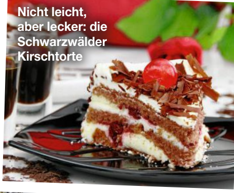
Nicht leicht, aber lecker: die Schwarzwälder Kirschtorte