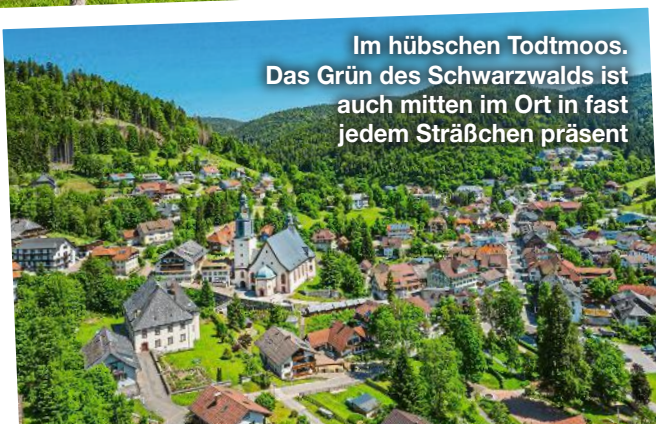
Im hübschen Todtnau. Das Grün des Schwarzwalds ist auch mitten im Ort in fast jedem Sträßchen präsent