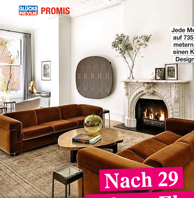
Jede Menge Platz auf 735 Quadratmetern, auch für einen Kamin und Designermöbel