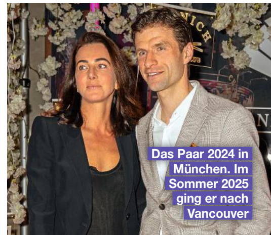
Das Paar 2024 in München. Im Sommer 2025 ging er nach Vancouver