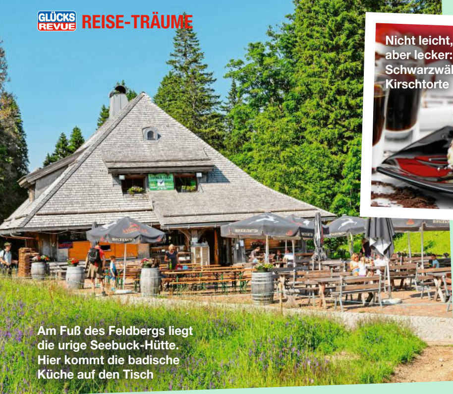
Am Fuß des Feldbergs liegt die urige Seebuck-Hütte. Hier kommt die badische Küche auf den Tisch