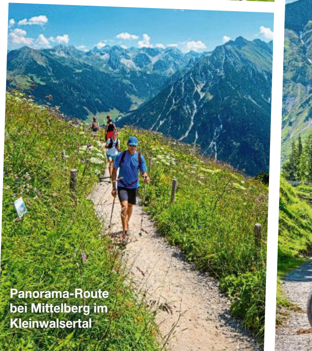
Panorama-Route bei Mittelberg im Kleinwalsertal