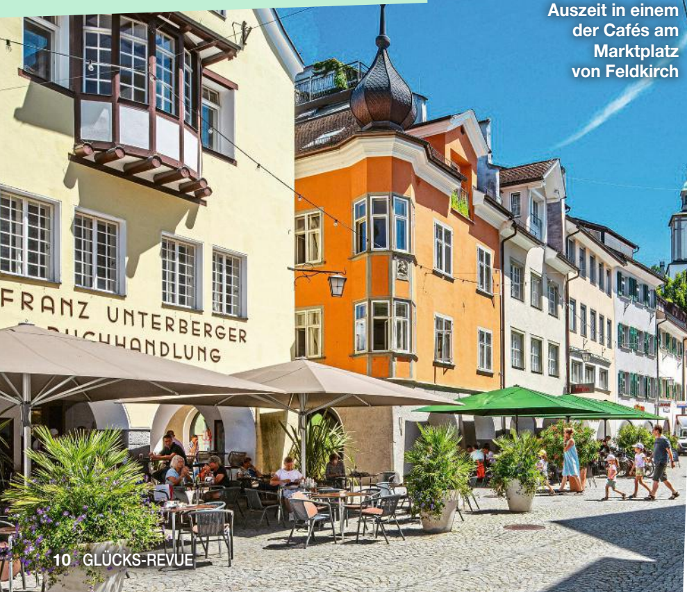
Auszeit in einem der Cafés am Marktplatz von Feldkirch