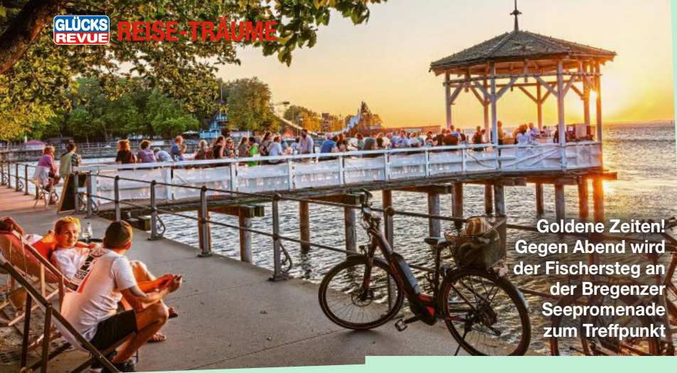
Goldene Zeiten! Gegen Abend wird der Fischersteg an der Bregenzer Seepromenade zum Treffpunkt