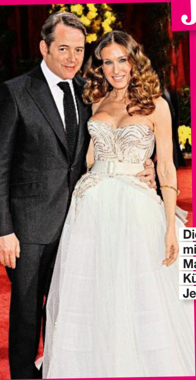
Die Schauspielerin mit Ehemann Matthew (l.). In der Küche mag Sarah Jessica Frisches