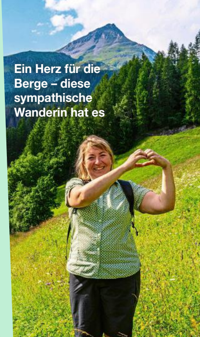
Ein Herz für die Berge – diese sympathische Wanderin hat es